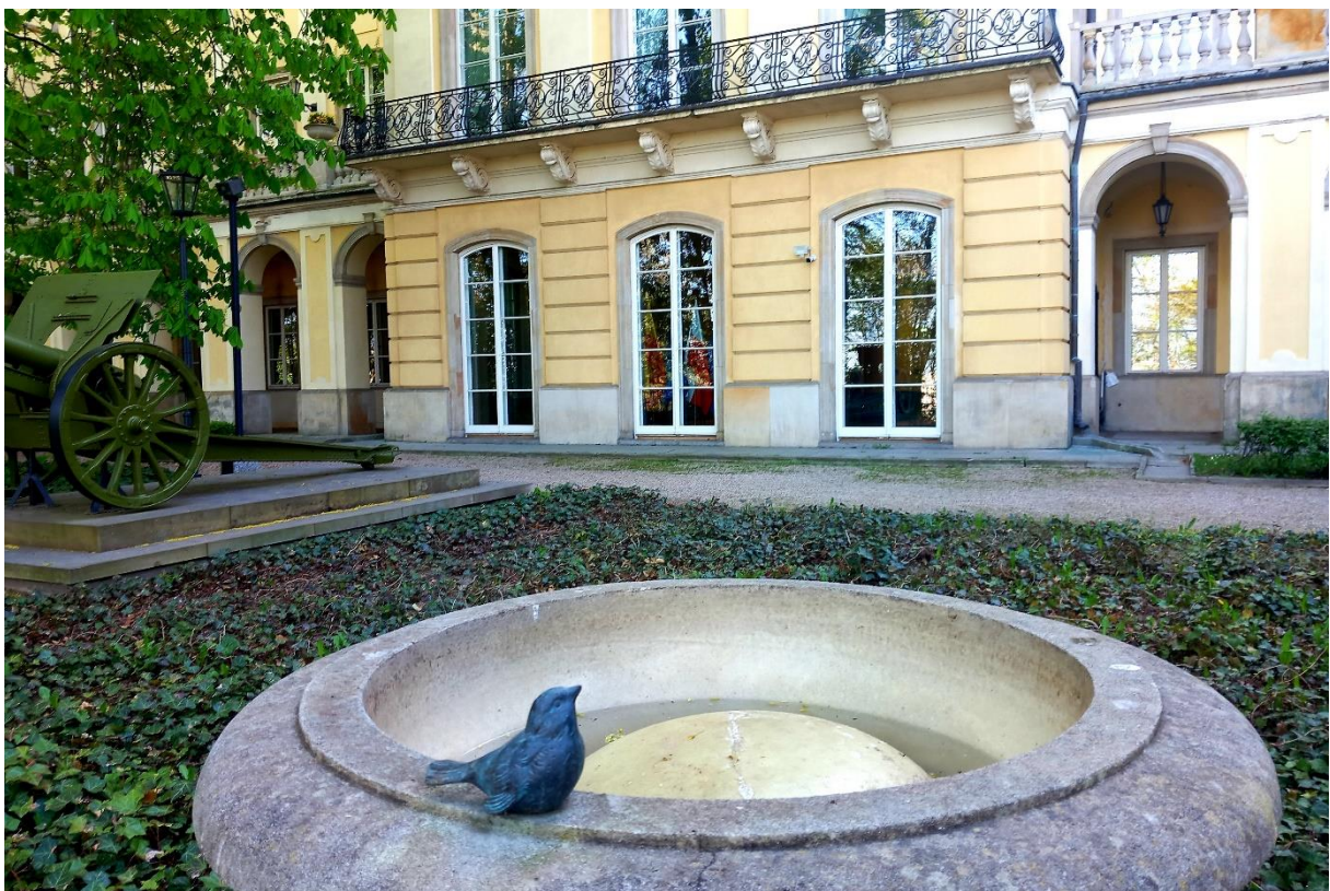
Pałac Kazimierzowski