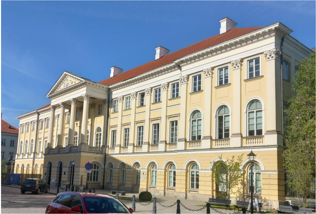
Pałac Kazimierzowski