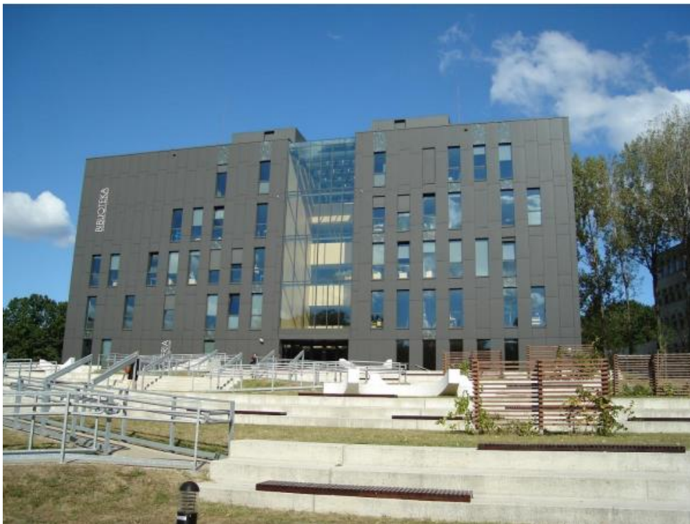
Biblioteka Uniwersytetu Zielonogórskiego

Uniwersalna Klasyfikacja Dziesiętna jako system uporządkowania zbiorów w Bibliotece Uniwersytetu Zielonogórskiego / Barbara Juszcak, Jolanta Patan. W: „Uniwersytet Zielonogórski - Miesięcznik Społeczności Akademickiej”, nr 9-10 |257-258| grudzień 2018–styczeń 2019, s. 21-23.