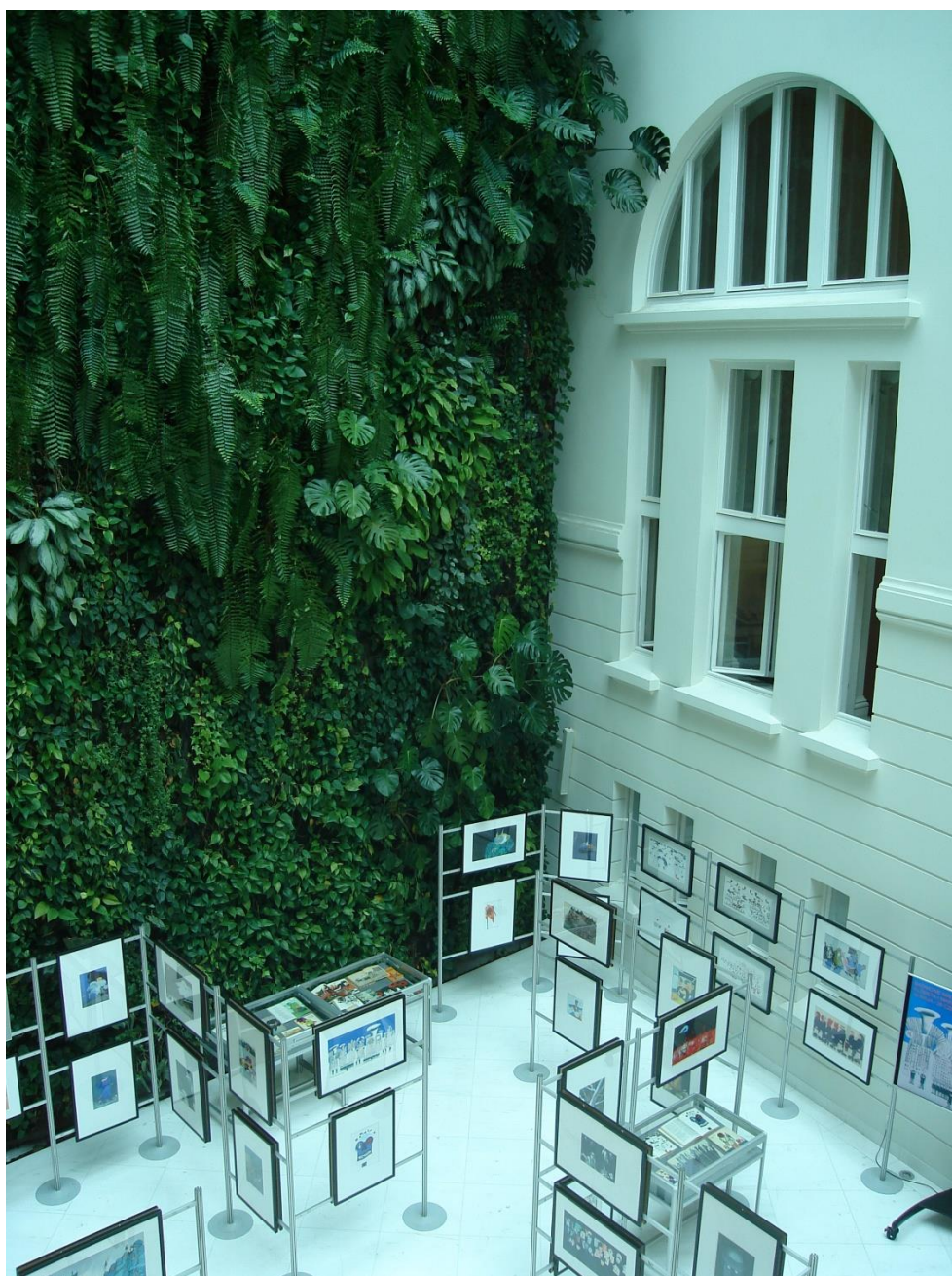
Zielona żywa ściana

W pierwszym dniu gościliśmy w Bibliotece Publicznej m.st. Warszawy www.koszykowa.pl/ .