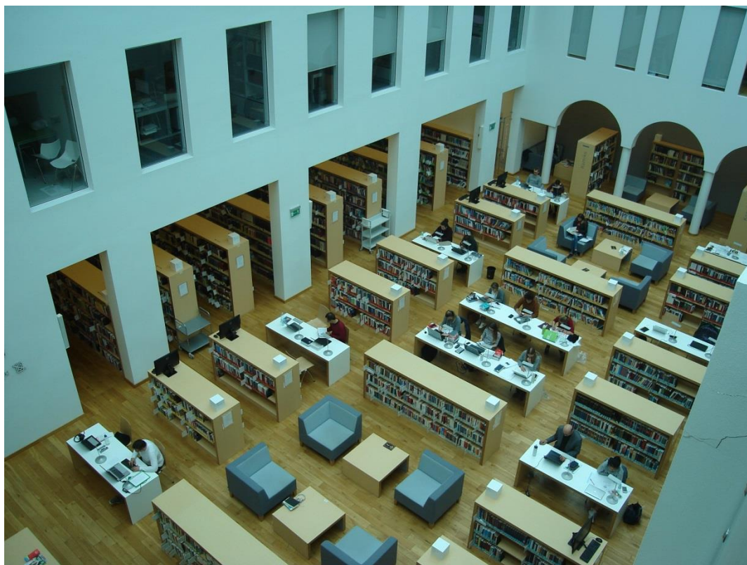
Czytelnia im. Faustyna Czerwijowskiego