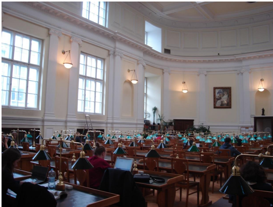
Czytelnia im. Stanisławów Kierbedziów

Zostaliśmy oprowadzeni m.in. po czytelni im. Stanisławów Kierbedziów, czytelni im. Faustyna Czerwijowskiego i po Muzeum Książki Dziecięcej.