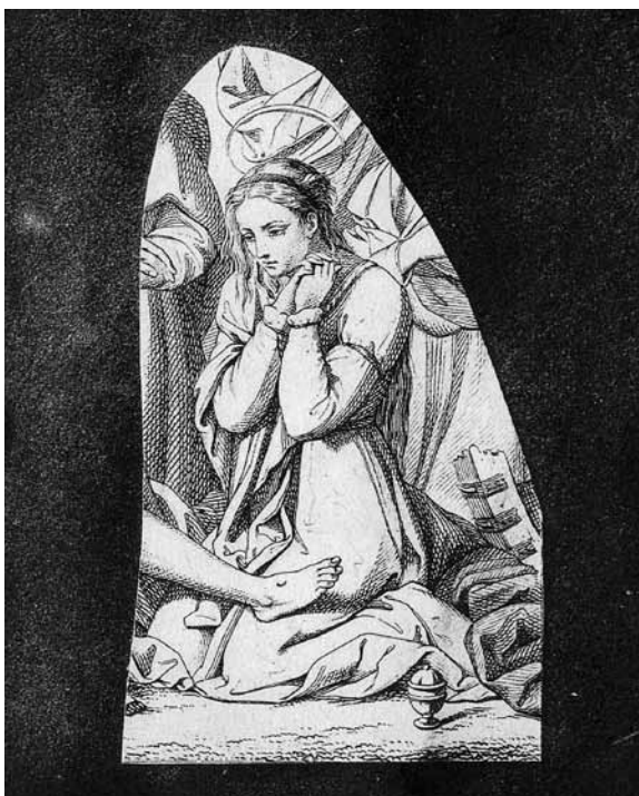
RYC. 7 Pochodząca ze zbiorów Przesmyckiego fotografia ryciny Święta Maria Magdalena z Albumu Berlińskiego Norwida

W tym miejscu wypada zasygnalizować kolejny nasuwający się problem badawczy. Jak wspomniano, oprócz akwaforty Grzech pierworodny znana jest zaledwie jedna tylko rycina, której autorstwo przypisywane jest Norwidowi, a która posiada jednoznacznie reprodukcyjny charakter. Przedstawia ona postać Marii Magdaleny klęczącej u stóp martwego Chrystusa. Właściwie jest to fragment graficznej reprodukcji obrazu Andrièa del Sarto (1486–1530) Pietà , przechowywanego w Galleria Palatina we Florencji. Rycina wklejona jest do Albumu Berlińskiego i znajduje się obecnie w zbiorach Muzeum Narodowego w Warszawie (porównaj ryc. 7) 17 . Odbitka sąsiaduje z adnotacją naniesioną obcą