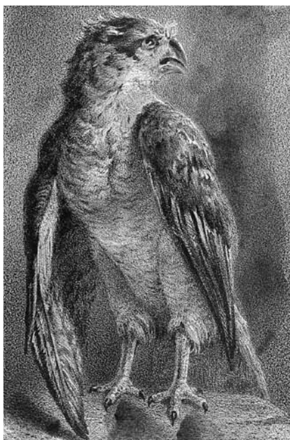
RYC. 8 Sokół z złamanym skrzydłem, litografia kolorowana akwarelą, ca 1850; ZZI BN, nr inw. G. 14449 – http://polona.pl/item/391376/0/

w poczet prac graficznych Norwida 31 . Ten podkolorowany akwarelą fragment nierozpoznanej ryciny pochodzi również z archiwum Norwidowskiego nabytego wraz ze zbiorami Zenona Przesmyckiego. Litografia nie nosi na sobie sygnatury autora. Nie ma cech grafiki reprodukcyjnej, może więc być częścią oryginalnej kompozycji. Nie posiada jednak znamion stylu typowego dla autorskich prac graficznych Norwida. Bardziej prawdopodobne jest, iż skrawek ten należał do zasobu zgromadzonych przez Sztukmistrza motywów, niż że mamy tu do czynienia z kolejną unikatową pracą graficzną Norwida. Trudno powiedzieć, czy wycinek ten mógł stać się inspiracją do rysunku Biały orzeł na skale (ryc. 9), który Hanna Widacka zestawiała z litografią. Gwoli ścisłości należy bowiem zaznaczyć, że litografia przedstawia raczej sokoła niż orła, o czym świadczy charakterystyczny kształt krótkiego dzioba i jasne, centkowane ubarwienie upierzenia na tułowiu, kontrastujące z ciemnymi piórami na skrzydłach.