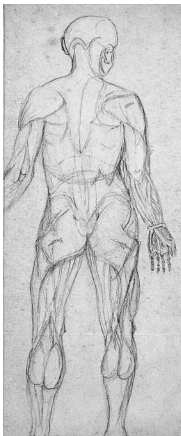
RYC. 4 Autor nieznan, Układ mięśniowy człowieka , ca 1850, litografia, 52,2 × 28,8 cm; ZZI BN, nr inw. G.22248 – http://polona.pl/item/5582278/0/