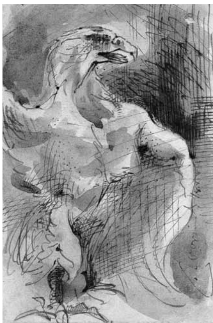
RYC. 9 Biały orzeł na skale, tusz-pióro, ołówek, akwarela, ca 1860–1869; ZZI BN, nr inw. R.841 – http://polona.pl/item/396946/0/