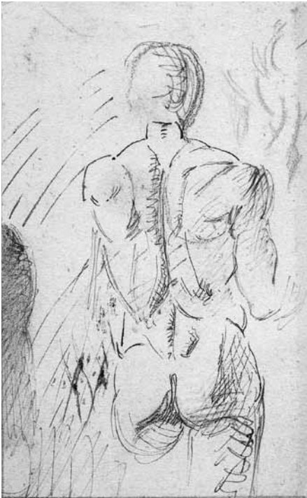
RYC. 6 C. Norwid, Studium aktu męskiego tyłem , tusz-piéro, kredka, ca 1860, 8,5 × 6,2 cm; ZZI BN, nr inw. R.647 – http://polona.pl/item/391943/0/

w formie swoistych plastycznych notatek 14 , nazywanych owymi „karteczkami, złamkami” i „narzucającymi się szkicami” 15 . Inny rysunek – Studium aktu męskiego tyłem (ryc. 6) – to próbka takiej właśnie drobnej realizacji plastycznej, rejestrującej w bardziej swobodnej, kreatywnej formie kolejny etap refleksji artysty nad tą samą ludzką sylwetką. Na tego typu przykładach, zachowanych jako część artystycznego atelier, można śledzić bieg myśli Norwida. W jego spuściźnie plastycznej wiele jest podobnych studiów ludzi i zwierząt. Przyglądając się im, stwierdzamy, że anatomia ciała, jej odzwierciedlenie w motoryce ruchu i wyrazie gestu, interesowały Sztukmistrza szczególnie. Przywołany wcześniej rysunek Studium postaci Ewy z fresku Rafaela „Grzech pierworodny” jest również dobrą ilustracją tego typu dociekań i zarazem próbą odgadnięcia warsztatowych tajemnic dawnego arcydzieła. Z tego typu „złamków” Norwid