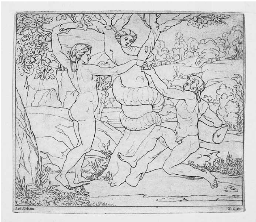
RYC. 1 Odbitka akwaforty ze zbiorów Zenona Przesmyckiego; ZZI BN, nr inw. G.22189

Pobieżna analiza stylistyczna ryciny nasuwa szereg wątpliwości co do ustalonego przez Hannę Widacką autorstwa. Badaczka sama zresztą zwróciła uwagę na „czysto reprodukcyjny, konturowy” charakter tej pracy, nie wyciągnęła jednak z tego stwierdzenia dalszych wniosków. Rzeczywiście kompozycja ta nosi wszelkie cechy typowych dziewiętnastowiecznych grafik reprodukcyjnych. Jest w związku