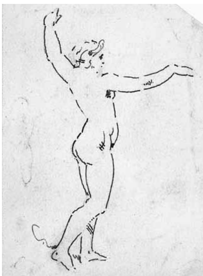
RYC. 3 C. Norwid, Studium postaci Ewy z fresku Rafaela „Grzech pierworodny” , ca 1860, atrament – pióro, ołówek, 12,1 × 8,8 cm; ZZI BN, nr inw. R.768 – http://polona.pl/item/396396/0/

mistrzu, Consòni stworzył wówczas własną bottegę. Sam wykonał 24 sceny ilustrujące Mękę Chrystusa, całości projektu dopełnili zaś jego współpracownicy – Alessandro Mantovani, malując groteski oraz Pietro Galli, tworząc dekoracje stiukowe. Omawiana grafika ze sceną zerwania zakazanego owocu powstała właśnie w związku zainteresowaniem Consòniego twórczością Rafaela. Pochodzi ona z obszernego cyklu 50 akwafort reprodukujących dzieła Mistrza z Urbino, opublikowanych w roku 1841 w formie albumu Raccolta delle opere di Raffaello 9 . Wymiary kompozycji Grzech pierworodny w tej publikacji pokrywają