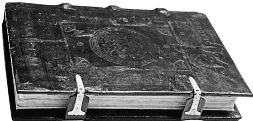
1. Ioannis Lodovici Vivis Valentini Declamationes sex. Syllanae quinque..., Basileae [1538, in officina Roberti Winter]

Również w XVI-wiecznej Polsce Vives był bardzo obecny – spory wpływ wywarł m.in. na Frycza-Modrzewskiego 10 . Szczególną karierę zrobiły uwzględniające sytuację dnia codziennego rozmówki łacińskie Exercitationes linguae Latinae , które ukazały się w Gdańsku w roku 1594 w wersji trójjęzycznej (łacińsko-niemiecko-polskiej) stając się w ten sposób również podręcznikiem do nauki języka polskiego 11 . W Polsce czytane były jednak głównie jego dziełka mniejsze, rzadziej największy traktat De disciplinis 12 .