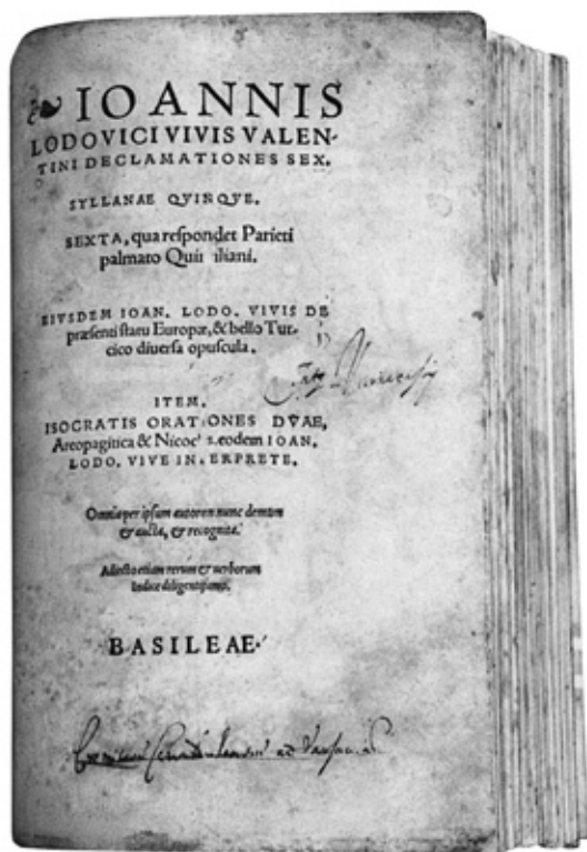
2. Ioannis Lodovici Vivis Valentini Declamationes sex..., strona tytułowa

Erem Mons Regius i kościół pw. Niepokalanego Poczęcia NMP w Warce ufundowany został przez króla Władysława IV w roku 1641. Od 1814 r. przy eremie istniał nowicjat, który zamknięty został w 1863, w ramach represji po Powstaniu Styczniowym. Erem skasowano w 1902 roku, a w 1904 ostatnich kamedułów wywieziono do Nowego Miasta nad Pilicą (powiat Grójec).