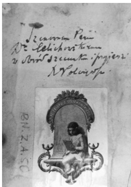
5. De officio pastorvm et ovivm..., wyklejka oprawy górnej

Na karcie tytułowej u dołu znajduje się poza tym dwukrotny przekreślony wpis pochodzący prawdopodobnie z początku XIX lub końca XVIII w.: Kazmierski oraz Kazmierzki 40 . Ponadto na dolnych obcięciach kart inicjały W Ł . W obu przypadkach chodzi zapewne o wcześniejszych właścicieli.