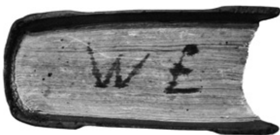
6. De officio pastorvm et ovivm..., obcięcia kart

Na karcie tytułowej u dołu znajduje się poza tym dwukrotny przekreślony wpis pochodzący prawdopodobnie z początku XIX lub końca XVIII w.: Kazmierski oraz Kazmierzki 40 . Ponadto na dolnych obcięciach kart inicjały W Ł . W obu przypadkach chodzi zapewne o wcześniejszych właścicieli.