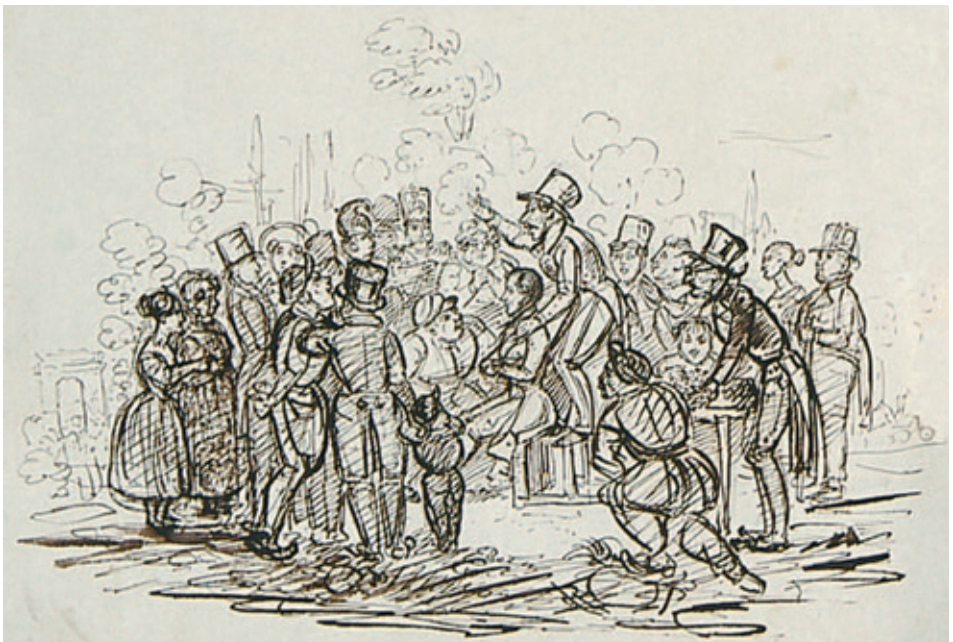
IV. Autokarykatura w scenie ulicznej, Rps BN akc. 1861, k. 100v