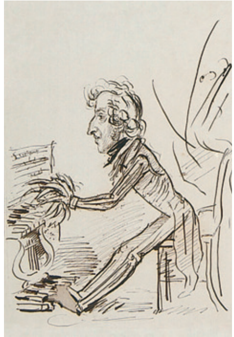
III. Fryderyk Chopin przy piano-pédalier , Rps BN akc. 1861, k. 262v