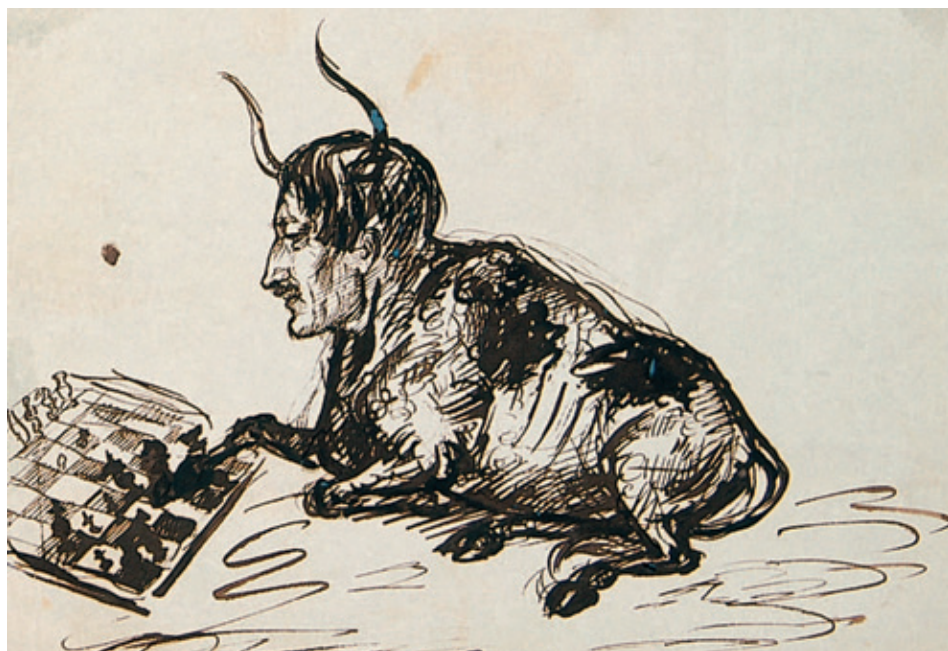
XIV. Karykatura niezidentyfikowanego mężczyzny, Rps BN akc. 1861, k. 86r