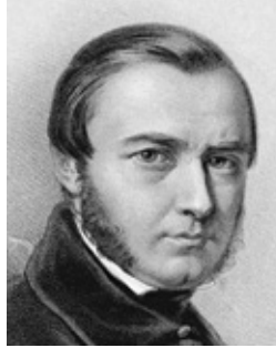
18. Portret Jana Ksawerego Kaniewskiego (fragment), ZZI G.236 (Polona)