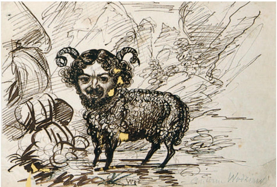
XII. Antoni Wodziński, Rps BN akc. 1861, k. 26r