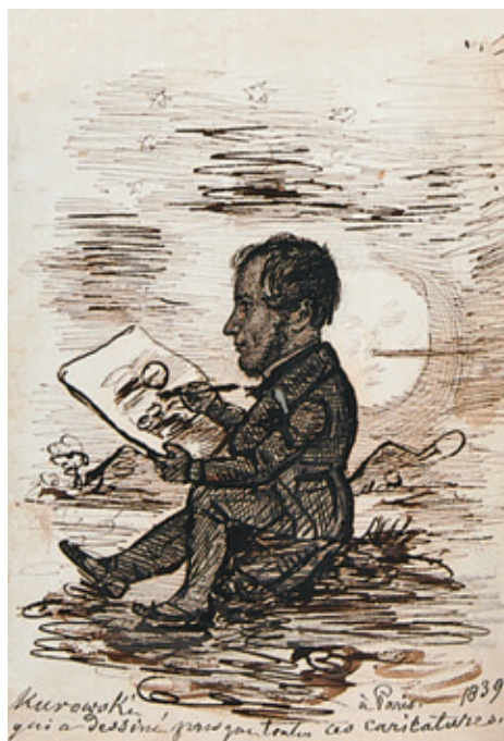
V. Autokarykatura ze szkicownikiem, Rps BN akc. 1860, k. 47v