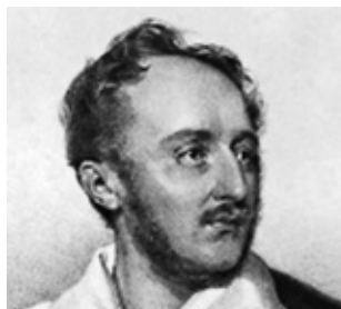
16. Portret Wiktora Ossolińskiego (fragment), ZZI G.3341 (Polona)