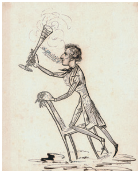
I. Fryderyk Chopin wygłaszający toast, ZZI BN R.21449