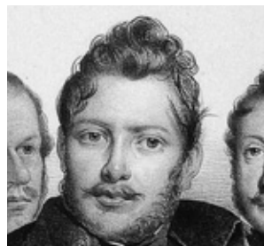
10. Portret Walentego Krosnowskiego (fragment), ZZI A.2927 (Polona)