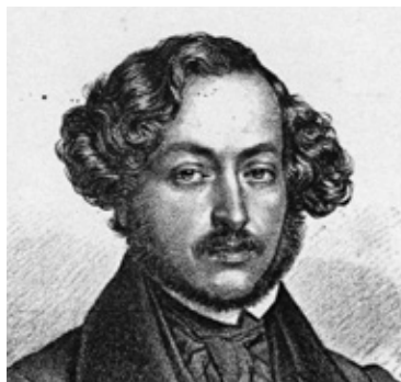
6. Portret Aleksandra Jełowickiego (fragment), ZZI G.6019