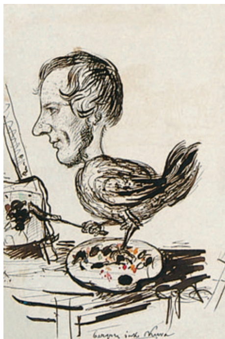
VI. Autokarykatura z paletą malarską, Rps BN akc. 1861, k. 172v