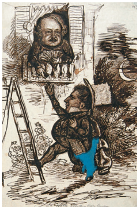
X. Scena z opery La double échelle Thomasa Ambroise'a, Rps BN akc. 1861, k. 14r