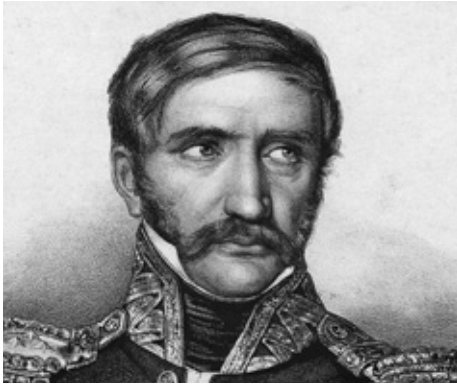
3. Portret gen. Dembińskiego (fragment), ZZI G.6763 (Polona)