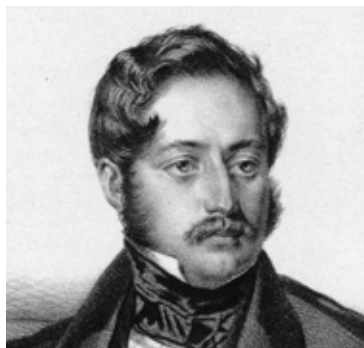
8. Portret Edwarda Jełowickiego (fragment), ZZI G.25130