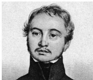
14. Portret Edwarda Rottermunda (fragment), ZZI A.2927