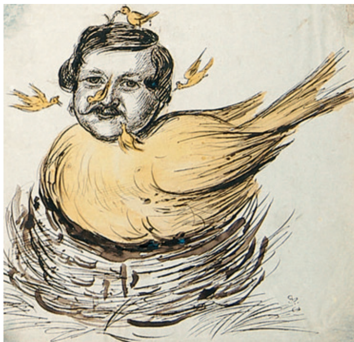
XVI. Karykatura niezidentyfikowanego mężczyzny, Rps BN akc. 1861, k. 32v