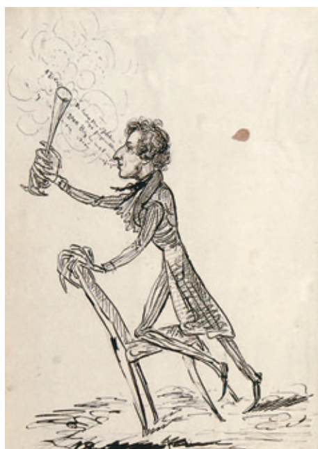
II. Fryderyk Chopin wygłaszający toast (replika autorska), Rps BN akc. 1861, k. 133v