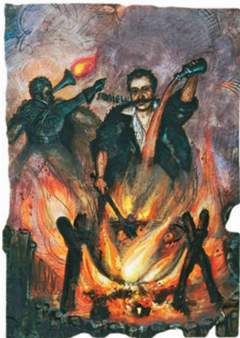
IX. Scena z II aktu opery Wolny strzelec ( Der Freischütz ) Carla von Webera, Rps BN akc. 1861, k. 8r