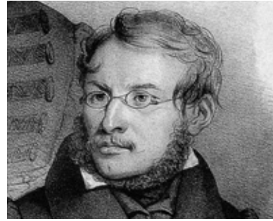
12. Portret Leonarda Rettela (fragment), ZZI A.2927