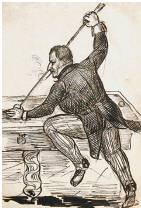
XIII. Karykatura niezidentyfikowanego mężczyzny, Rps BN akc. 1861, k. 26v