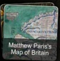
Matthew Paris's Map of Britain