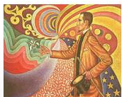
Paul Signac paints "Portrait of Felix" 1889