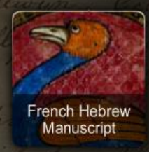
French Hebrew Manuscript