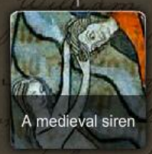
A medieval siren