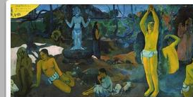
Gauguin paints "Where Do We Come..." 1897 to 1888