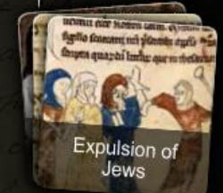
Expulsion of Jews