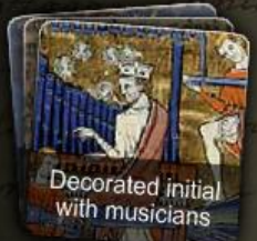
Decorated initial with musicians