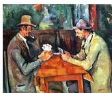
Paul Cézanne paints "The Cardplayers" 1892