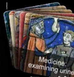
Medicine: examining urine