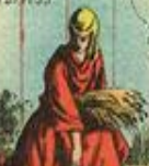
AND A BITTIS.

Souls Capital was at Gibeath, 3 miles north of Jerusalem. IN THE TIME OF GIDEON 7 RUTH MARRIED BOAZ 1256. A KINSMAN OF NAOMI. "HER MOTHER, IN LAW" FROM BOAZ SPRANG OBED, DAVID, ETC. "WHO ART THOU?" Ru. 3:9.