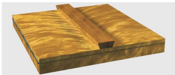
I i II. Kasetka z czeczotkowego drewna, wykonana po przekazaniu Kazań świętokrzyskich Bibliotece Narodowej w Warszawie