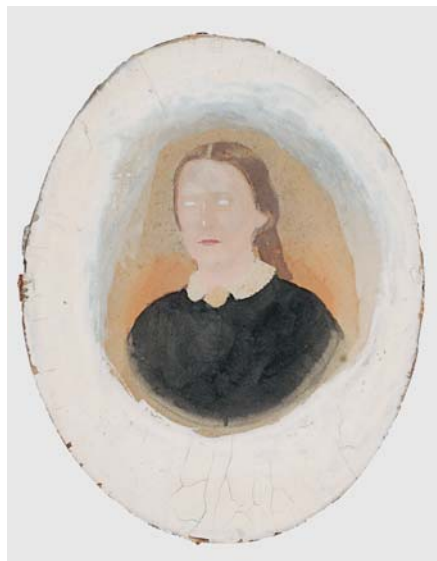
II. Schematyczne tło, tempera, przed konserwacją