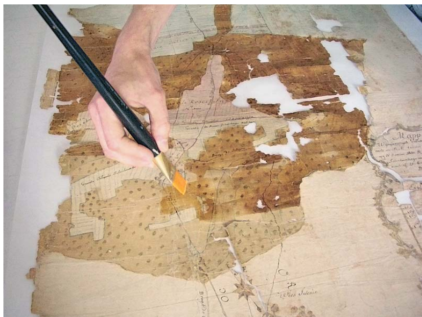
III. Nakładanie roztworu kwasu DTPA na zniszczone grynszpanem fragmenty obiektu