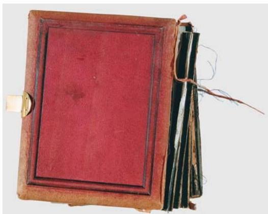
II. Tylna okładka albumu przed konserwacją