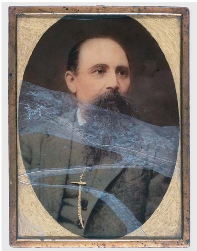
III. „Portret mężczyzny”, około 1880 r. (9,5×12,5 cm) – pęknięcia w kilku miejscach szyba oraz specyficzne zniszczenia wzdłuż tych pęknięć, przed konserwacją