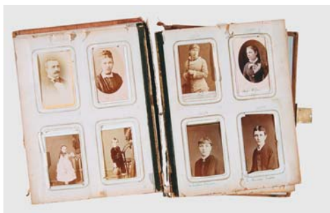
III. Karty albumu przed konserwacją