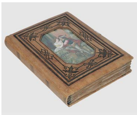
V. Przednia okładka albumu po konserwacji