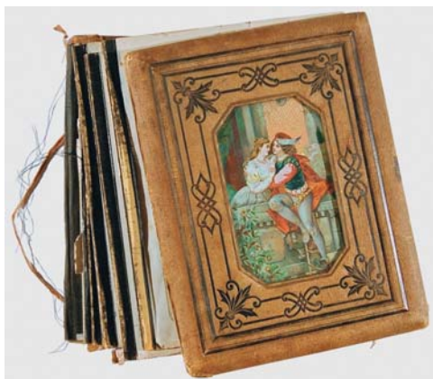
I. Przednia okładka albumu przed konserwacją

Konserwacja albumu fotograficznego z przełomu XIX i XX w. z fotografiami rodziny Dihm. Album i fotografie – razem czy osobno?