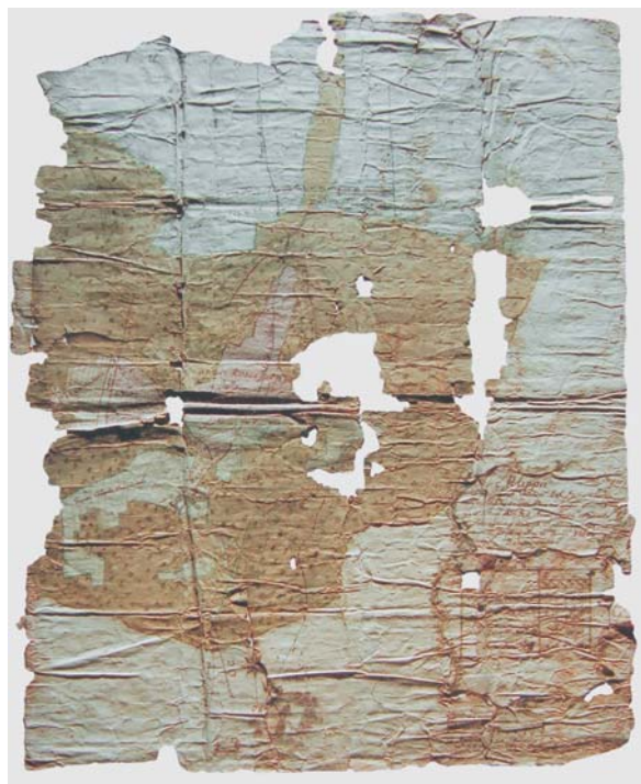
I. Obiekt przed konserwacją, światło boczne