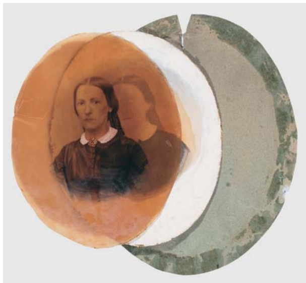
I. „Portret kobiety”, ok. 1880 r. (9,5×12,5 cm), kilka elementów z obiektu, przed konserwacją

Nietypowe fotografie – konserwacja i restauracja dwóch portretów