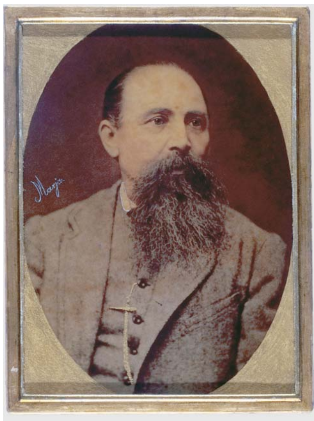
VI. „Portret mężczyzny” – lico, po konserwacji