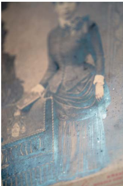
VI. Srebrzenie na fotografii żelatynowej – przed konserwacją