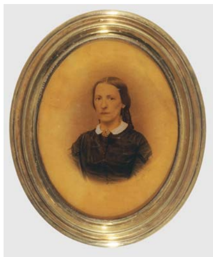
V. „Portret kobiety” – lico, po konserwacji