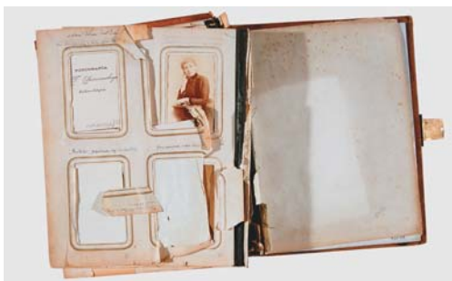
IV. Tylna wyklejka przed konserwacją