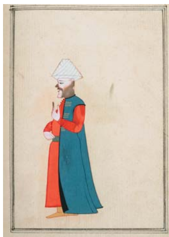
XII i XIII. Odbicie górnej części stroju z karty 72 na karcie twarzy postaci z karty 71