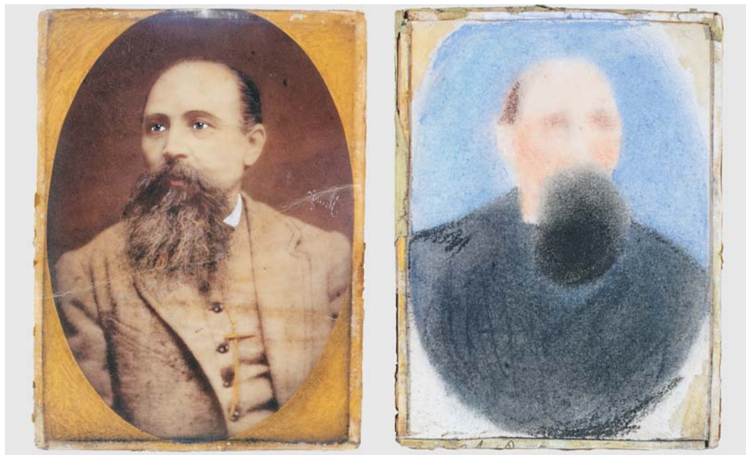
IV. Zdjęta z szyby fotografia albuminowa ( verso ) obok tekturowego tła w technice pastelu, stan w trakcie konserwacji