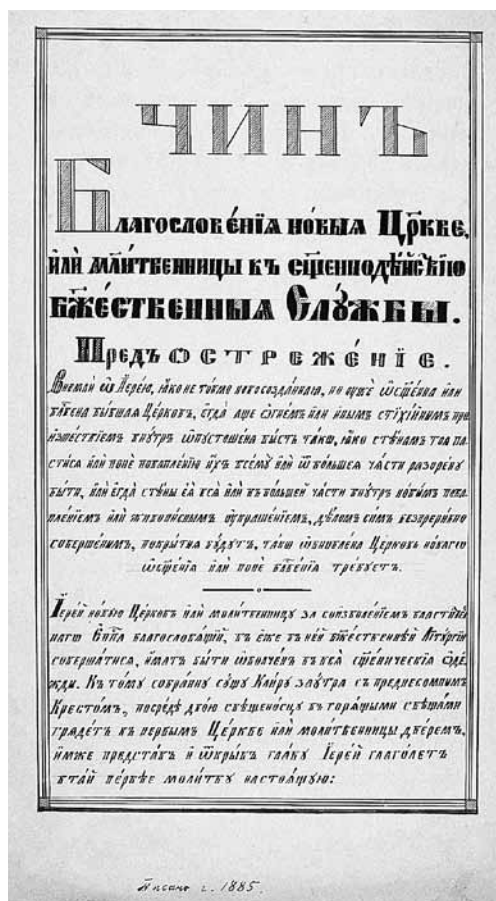
RYC. 2 Ryt poświęcenia nowej cerkwi, sygn. BN rps 11938 IV – http://polona.pl/item/10171657/2/