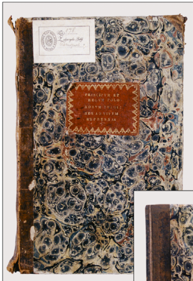
I. Stary druk „Principum et Regum Poloniarum Imagines ad Vivum Expressae”, autorstwa Arnolda Myliusza Niderlandczyka wydany w 1596 roku, stan przed konserwacją, przednia okładka