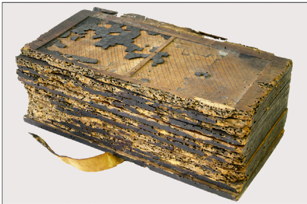
I. Polipytyk D przed konserwacją