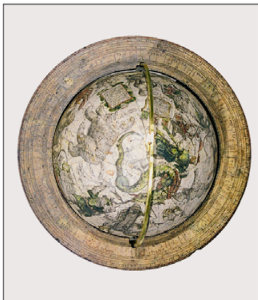
IV. Obręcz horyzontalna i czasza po konserwacji. Zabrudzenia usunięto za pomocą specjalnego żelu myjącego, uzupełniono ubytki i scalono kolorystycznie grafiki