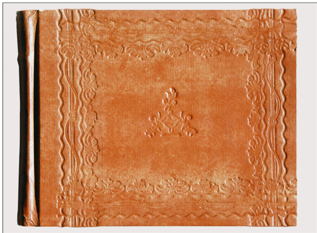
IV. Atlas C. Lottera, stan po konserwacji, przednia okładka