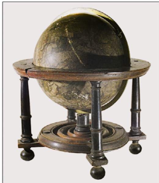
I. Globus przed konserwacją. Widoczne ubytki w konstrukcji drewnianej, wadliwy i uszkodzenia czaszy