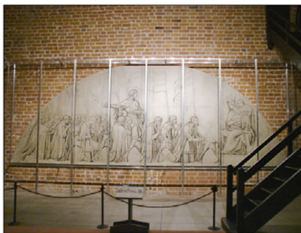
VIII. Obiekt po konserwacji za ekranem ochronnym