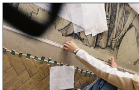
V. Uzupełnianie dolnej krawędzi