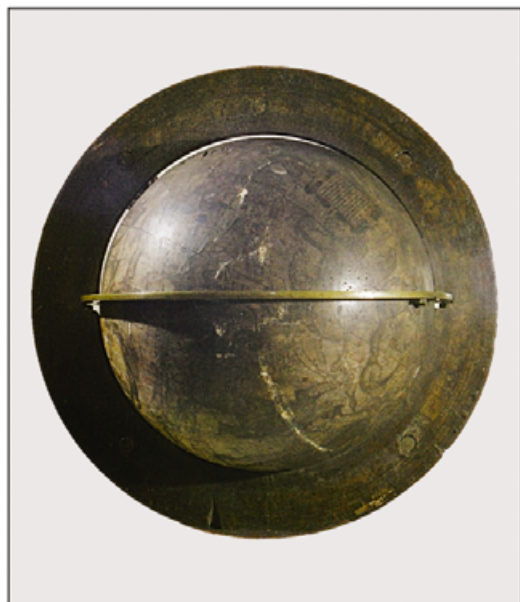
III. Obręcz horyzontalna i czasza przed konserwacją. Zabrudzenia i zniszczenia grafik w 90% ograniczyły ich czytelność