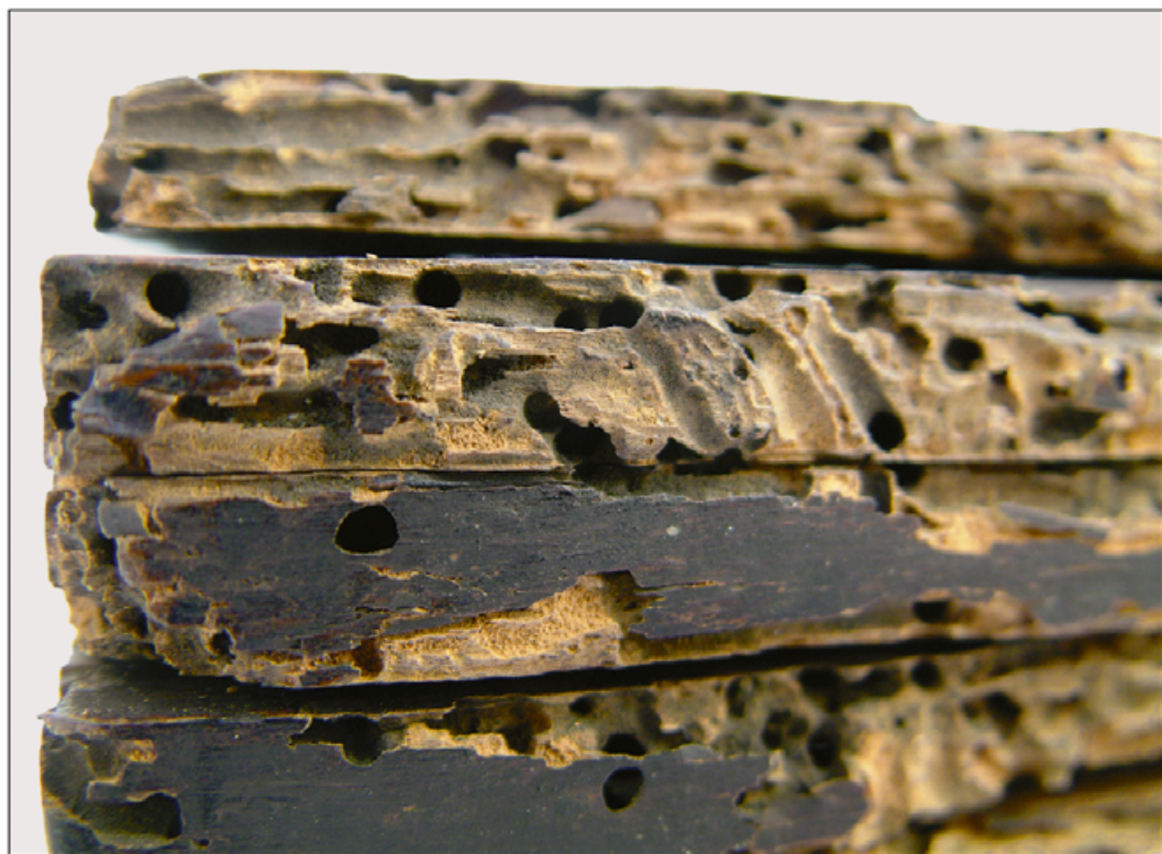
III. Zniszczone przez kołatki drewno tabliczek