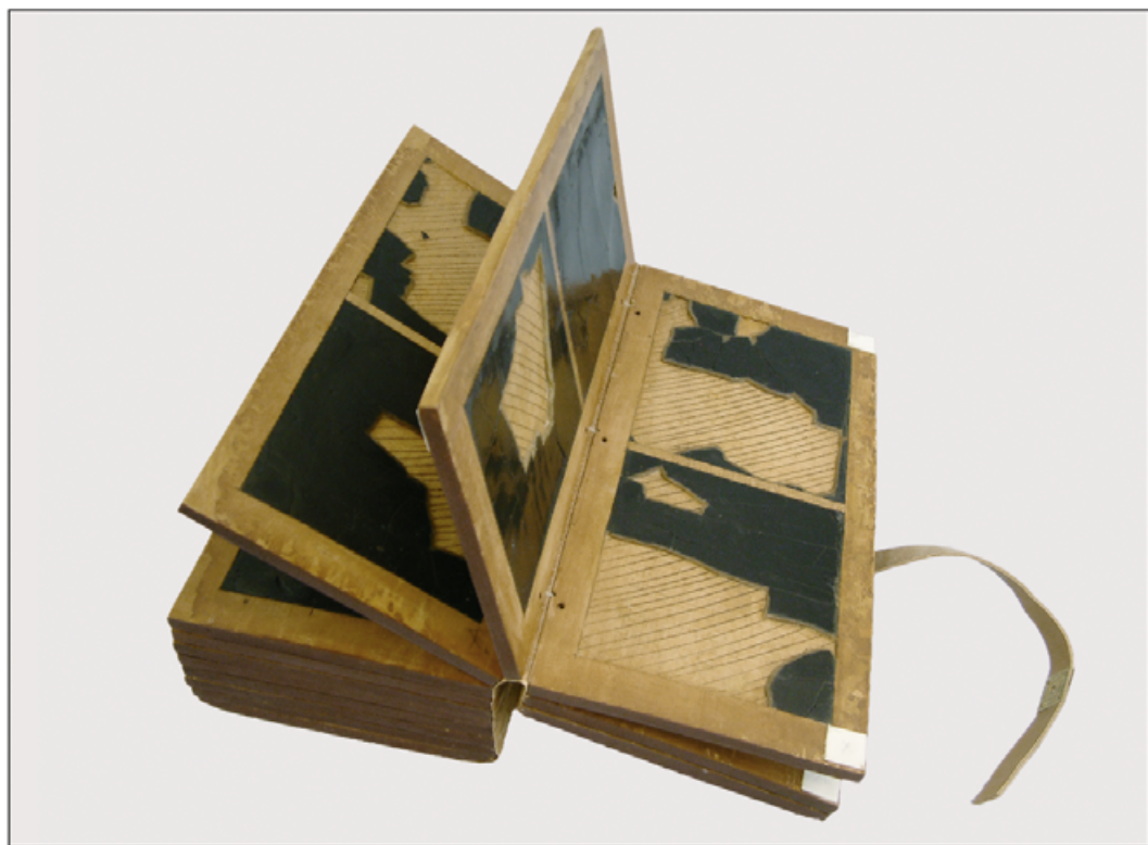
IV. Poliptyk D po konserwacji