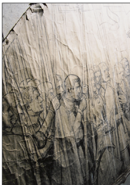
II. Fragment kartonu, widoczne zniszczenia struktury papieru i warstwy rysunku – stan przed konserwacją