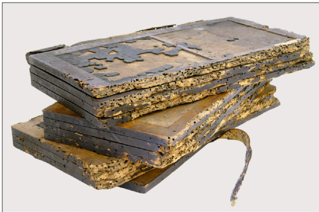
II. Polipytyk D przed konserwacją – widoczny podział na wiązki