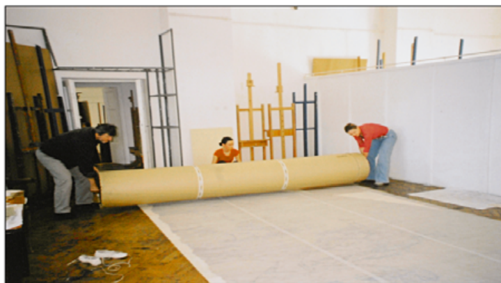
III. Nawijanie obiektu na walec transportujący