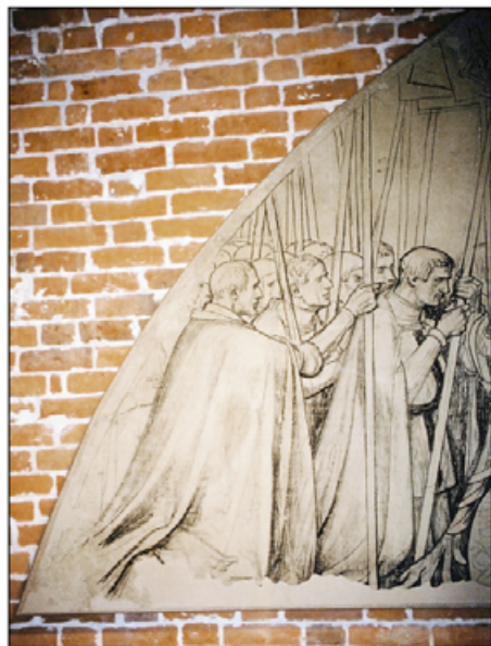
VII. Lewy narożnik po retuszach