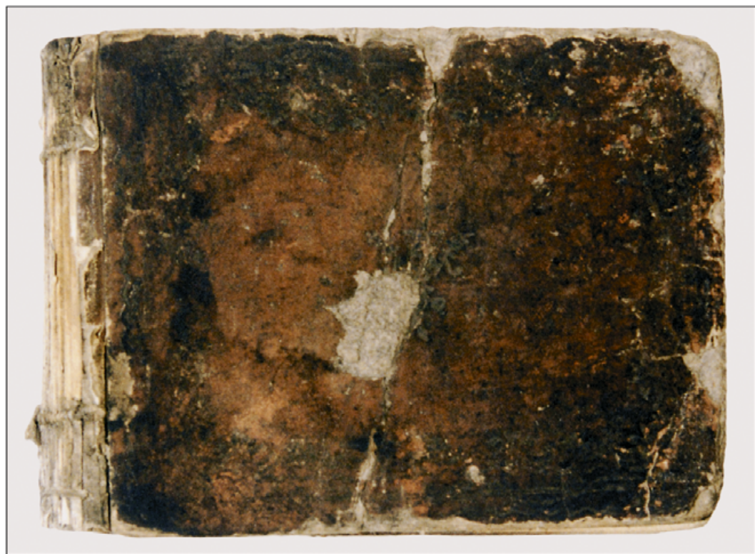
III. Atlas C. Lottera, stan przed konserwacją, przednia okładka