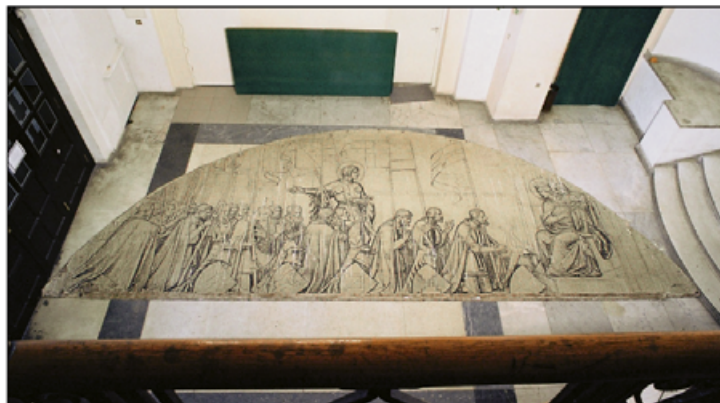
I. Karton przed konserwacją, hol budynku ASP przy Wybrzeżu Kościuszkowskim, tylko w tym miejscu z antresoli można było sfotografować karton w całości