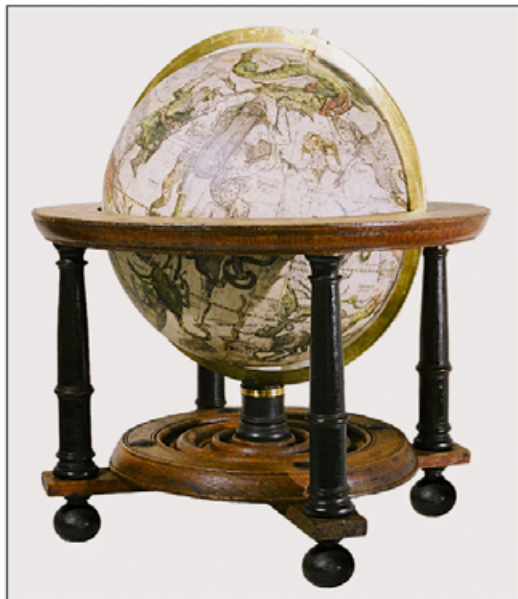
II. Globus – stan po konserwacji. Całość oczyszczono, umyto, zdjęto pozostałości werniks, zniwelowano deformację czaszy, uzupełniono ubytki i scalono kolorystycznie. Przywrócono prawidłowy sposób montażu