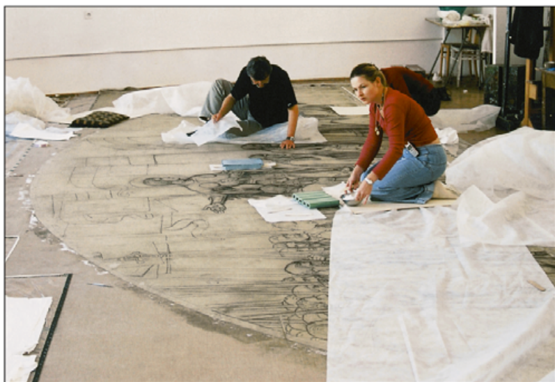
IV. Dublowanie, miejscowe dociskanie kartonu w partiach o wyjątkowo zniszczonej strukturze papieru