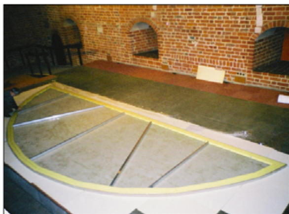
VI. Obiekt po zmontowaniu na krośnie